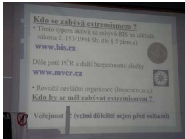
Ukázka z naší prezentace