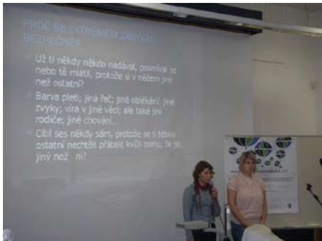
Pprevence ve škole,o.s.